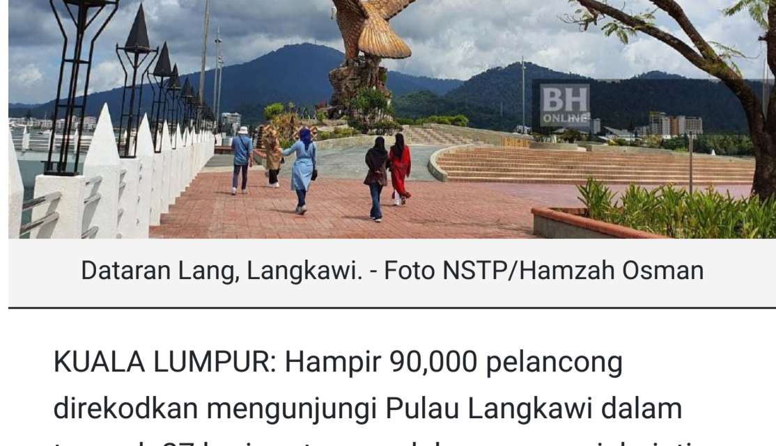
Dataran Lang, Langkawi.

KUALA LUMPUR: Hampir 90,000 pelancong direkodkan mengunjungi Pulau Langkawi dalam tempoh 27 hari pertama pelaksanaan projek rintis gelembung pelancongan domestik di destinasi percutian itu.